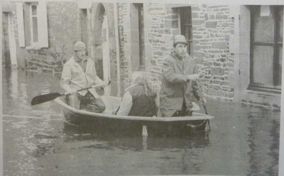
Les employés de la commune évacuent une personne âgée

Dans le secteur de Parc Braz, situé en bordure du Blavet, sévèrement touché, les barques se